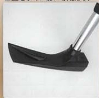
■土をすくい易い専用形状