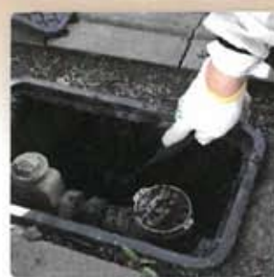
■ボックス内部の掘削に