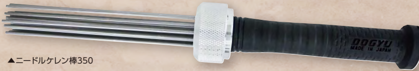
▲ニードルケレン棒350