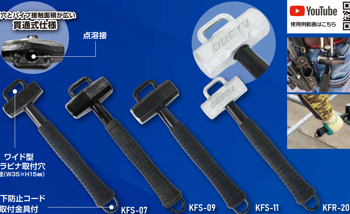
カラビナフック対応ハンマー