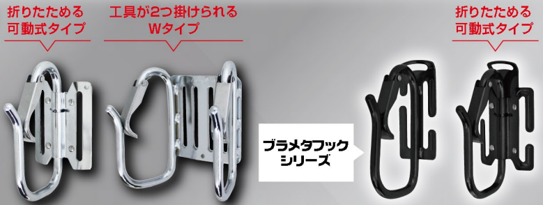
F-54 [可動式] F-53W FM-53 FM-54 [可動式]